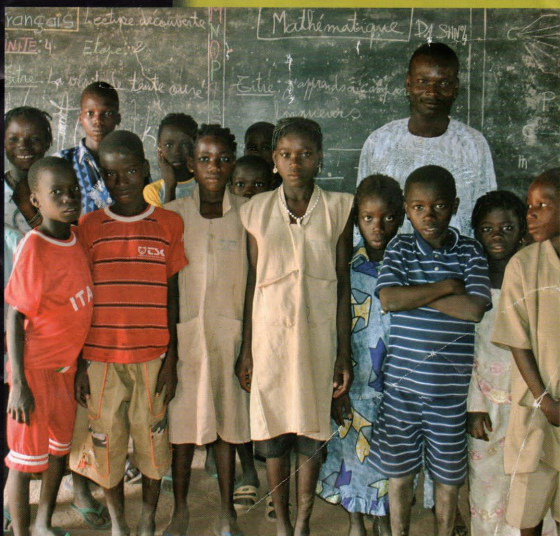
Dans une école d'un village de la commune de Djougou en novembre dernier lors de la dotation de fournitures scolaires. Le débat du 29 avril portera sur les réalités de la situation scolaire au Bénin.

Expositions, animations, débats, rencontres, fêtes, publications, site internet, ateliers d'artistes